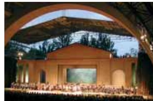
3 Militärkorps auf der Bühne des Passionstheaters mit provisorischer Bühnenüberdachung

Annähernd 2500 Zuschauer erleben am Samstag, den 11. Juni 2005 in Oberammergau eine imposante Konzertaufführung: 3 Militärkapellen füllten die Freilichtbühne des Passionstheaters und spielten abwechselnd oder vereint die „Spanische Nacht“, ein anspruchsvolles musikalisches Programm, das von Opernouvertüren (Giovanna d'Arco von Verdi, Rienzi von Wagner) über Stücke wie „The Hounds of Spring“, „Berlin-Medley“ und „Des großen Kurfürsten Reitermarsch“ reichte, um in einem Auszug aus „Capriccio Espagnol“, der „Carmen Fantasie“ (zusammen mit der Solistin Angelika Lichtenstern), „El