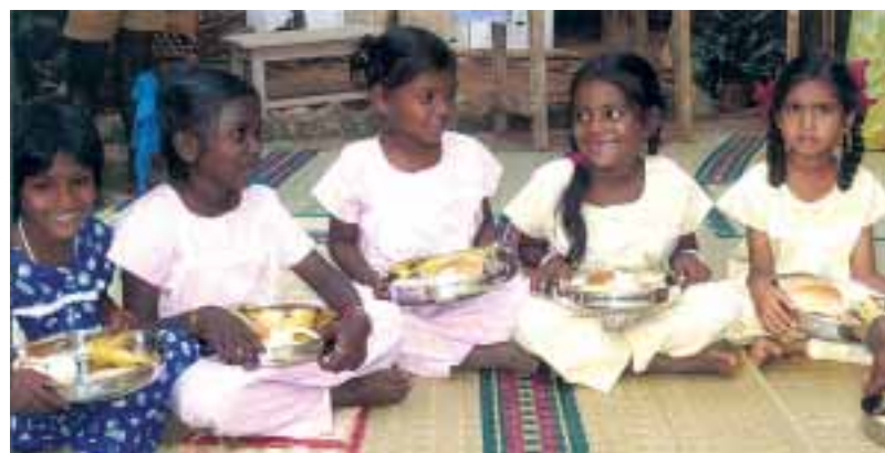
Kinder in der neue Förderschule

Mit dem festen Willen, langfristig, konkret und nachvollziehbar zu helfen, entschied der Gemeinderat von Oberammergau, die gesamten Einnahmen der Premiere des Schauspiels König David als Startkapital für dieses Vorhaben zur Verfügung zu stellen. .sk